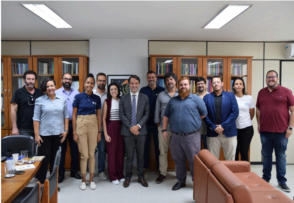
Figura 2: Registro da reunião realizada no dia 11/12/2023 para apresentação do projeto de pesquisa